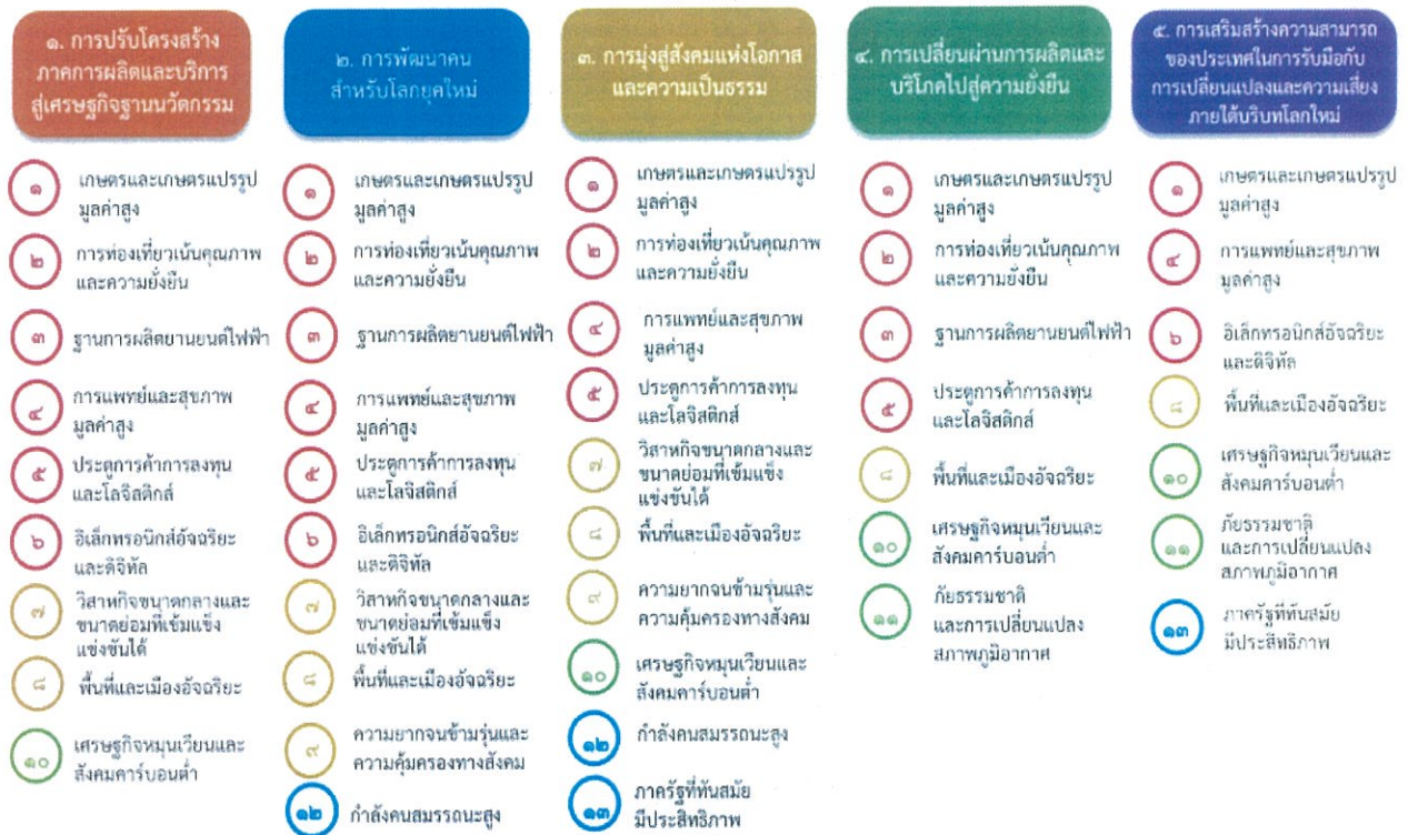
แผนภาพที่ ๓.๑ ความเชื่อมโยงระหว่างหมวดหมู่การพัฒนา กับเป้าหมายหลัก

ความเชื่อมโยงระหว่างหมวดหมู่การพัฒนา กับเป้าหมายหลักแสดงไว้ในแผนภาพที่ ๓.๑ โดยหมวดหมู่การพัฒนาที่กำหนดขึ้นเป็นประเด็นที่มีลักษณะเชิงบูรณาการที่ครอบคลุมการพัฒนาตั้งแต่ในระดับต้นน้ำจนถึงปลายน้ำ และสามารถนำไปสู่ผลพัฒนาทั้งในมิติเศรษฐกิจ สังคม ทรัพยากรธรรมชาติและสิ่งแวดล้อมไปพร้อมๆ กัน ทำให้หมวดหมู่แต่ละประการสามารถสนับสนุนเป้าหมายหลักได้มากกว่าหนึ่งข้อ นอกจากนี้การพัฒนาภายใต้แต่ละหมวดหมู่ไม่ได้แยกขาดจากกัน แต่มีการสนับสนุนหรือเอื้อประโยชน์ซึ่งกันและกัน