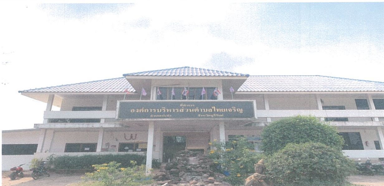
หมู่ ๗ บ้านหนองเสม็ด ตำบลไทยเจริญ