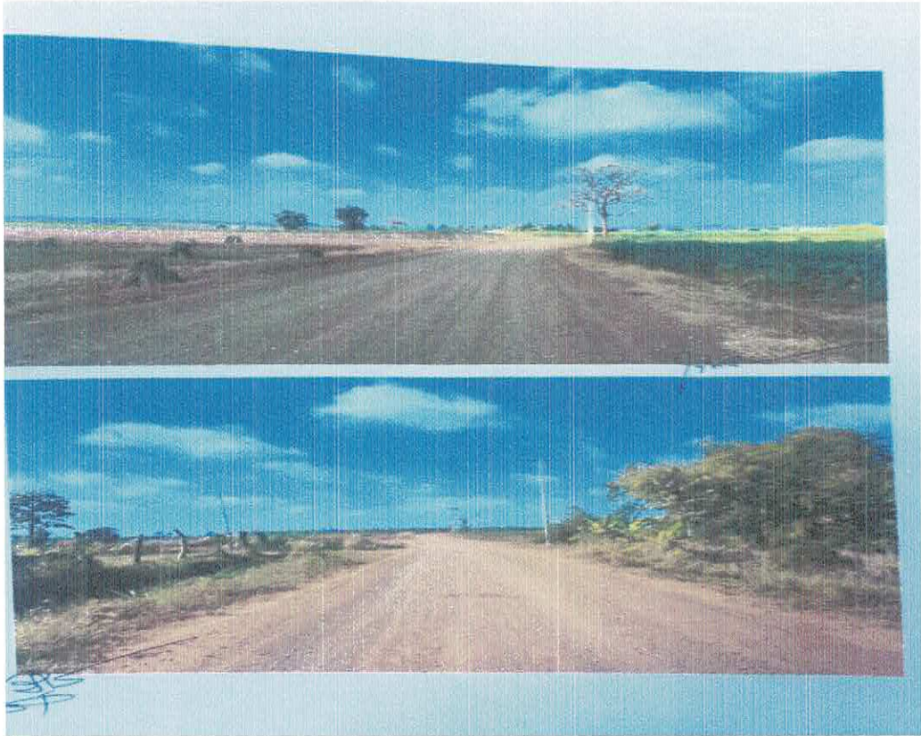
โครงการก่อสร้างถนนลาดยางแอสฟัลต์ติดคอนกรีต สายบ้านโคกสามัคคี ม.๓๓ ตำบลไทยเจริญ - บ้านวังแก้ว ม.๘ ตำบลโคกมะม่วง ตำบลไทยเจริญ อำเภอปะคำ จังหวัดบุรีรัมย์